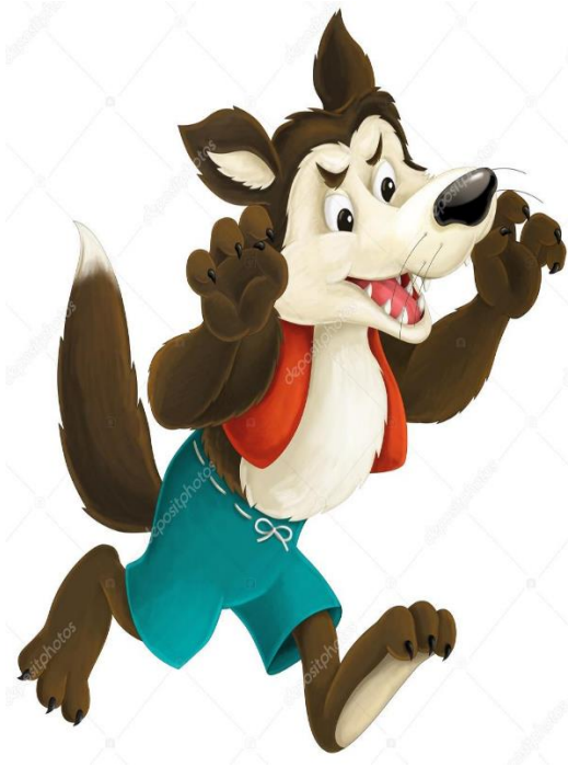
EL LOBO FEROS